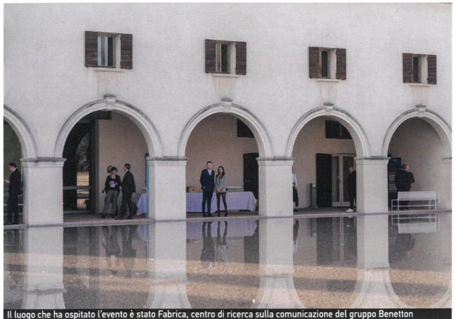
Il luogo che ha ospitato l'evento è stato Fabrica, centro di ricerca sulla comunicazione del gruppo Benetton

Fabrica è un luogo di contaminazione in cui arte, cultura e ricerca s'incontrano per dare vita a qualcosa di nuovo con workshop, conferenze e formazione